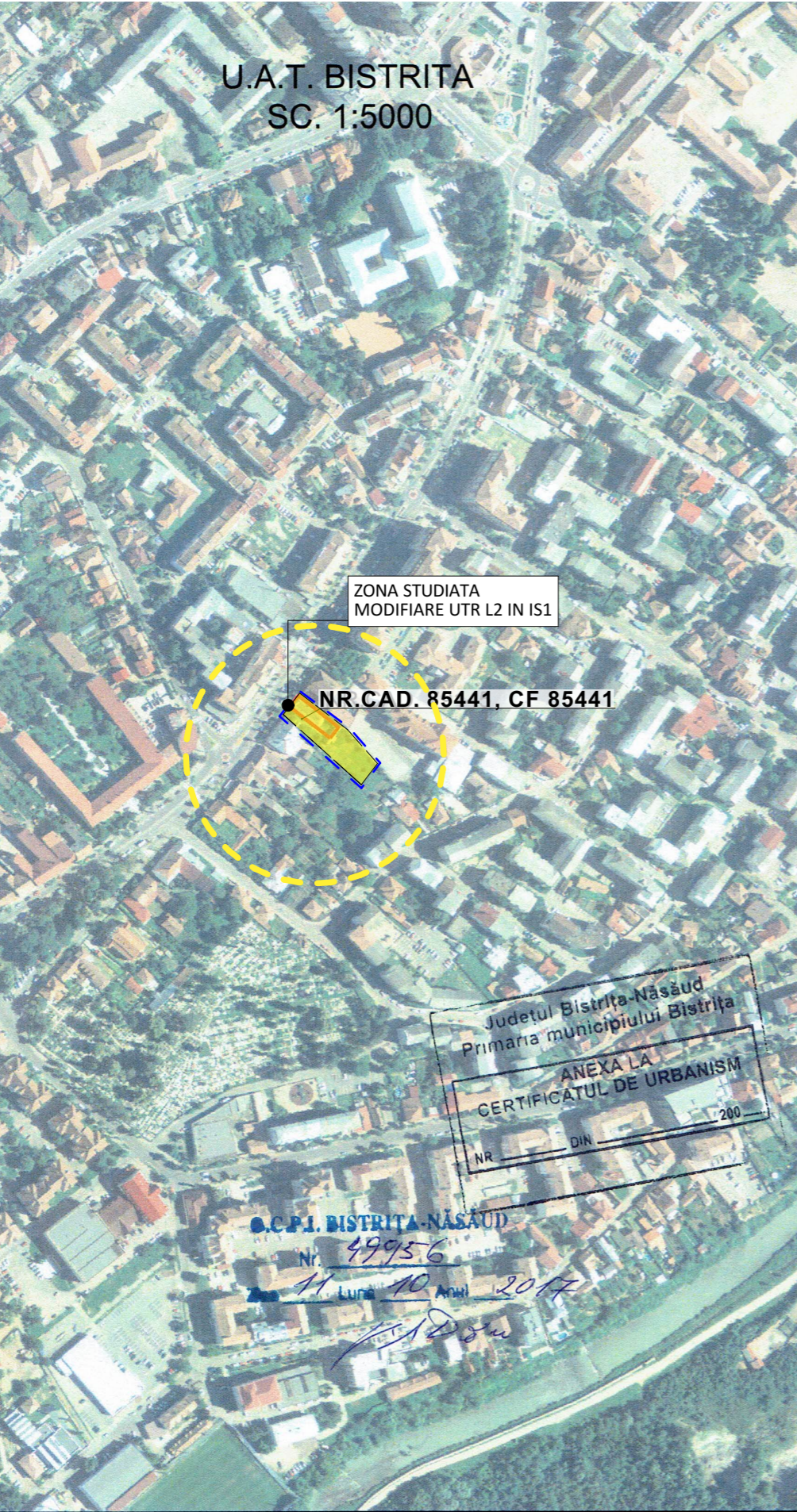
PLAN DE INCADRARE IN ZONA